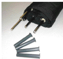
Tiges mâle et fourreaux