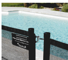
Loquet de sécurité